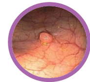
Pólipo en colon