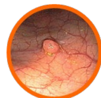
Pólipo en colon